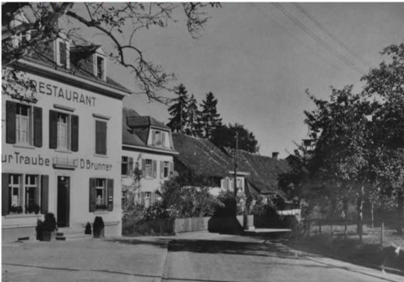
Therwilerstrasse vor Strassenkorrektion.

Therwilerstrasse 26, Restaurant «Traube»