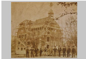
Schulhaus Hämisgarten: Aufriß mit Handwerker, 1907. Man besieht das Holzgerüst und die Rampe, anstelle eines Korns.