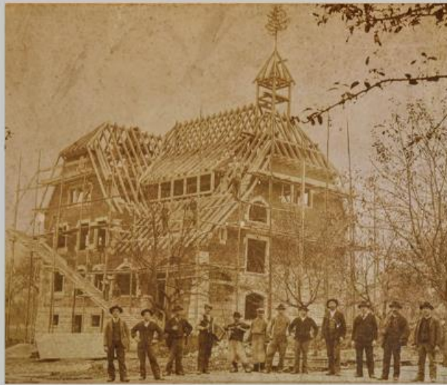
Schulhaus Hämisgarten: Aufrichte mit Handwerkern, 1905. Man beachte das Holzgerüst und die Rampe, anstelle eines Krans.