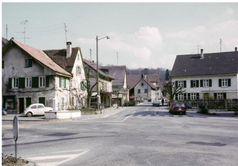
Dorfmitte um 1974: Gebäude links, Abbruch wegen Neubau Querverbindung. Der Dorfbrunnen wurde vor das Restaurant «Sonne» versetzt.