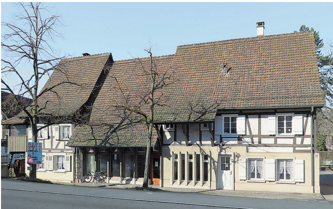
Das Dorfmuseum Bottmingen

Alle Museen sehen sich mit derselben Frage konfrontiert: wie bringen wir Besucher/innen in unser Museum? Wie schaffen wir es, dass es nicht bei einem einmaligen Besuch bleibt? Mit ein paar Öffnungstagen im Laufe des Jahres ist dieses Ziel nicht zu erreichen. Das wohl bewährteste Rezept ist es, immer wieder thematische Sonderausstellungen zu organisieren und die permanente Ausstellung von Zeit zu Zeit zu aktualisieren. Die chronikalische Aufstellung auf den Seiten 2 und 3 illustriert anschaulich, wie sich der Stiftungsrat dieser Aufgabe gestellt hat und dabei meist mehrere hundert Interessierte für einen Museumsbesuch motivieren konnte. Daneben wurden auch andere Strategien gewählt: so z.B. der Versuch, an den Öffnungstagen (Kurz-)Referate anzubieten. In den letzten Jahren sind mit ansprechendem Erfolg unterschiedlichste Themen angeboten worden wie z.B. «Von der BTB zur BLT», «Bottminger Spargel», «100 Jahre Vereinsleben in Bottmingen», «Brotheimer», «Die roten Fussweg-Tafeln» oder viele andere. Seit kurzem sind die Türen des Museums auch an den Wahl- und Abstimmungssonntagen geöffnet – wer sich (noch) persönlich an die Urne begibt, hat damit die Möglichkeit, neben Kaffee und Gipfeli auch die Museumsräume zu geniessen. Seit Mai 2011 existiert auch eine Webseite des Dorfmuseums, die Besucher/innen ins Museum locken soll – das dauerhafte Anliegen der Museumsmacher in gewandelter, digitaler Form.