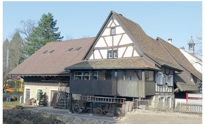
Südansicht, ein rarer Anblick ...